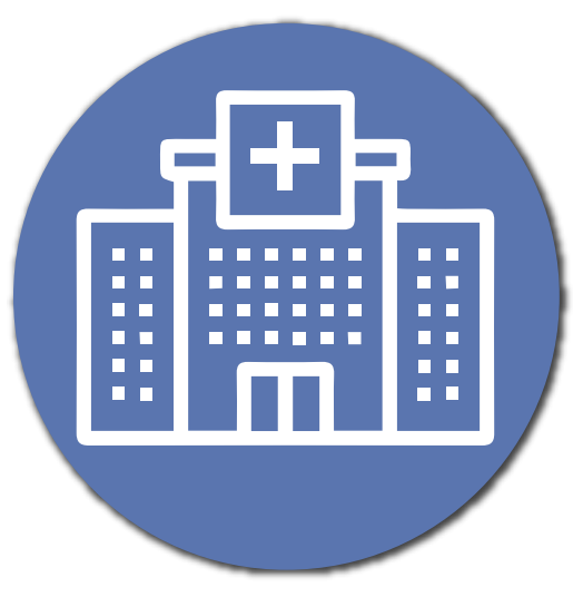
Hospitales y Centros de Atención Médica