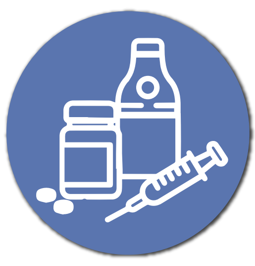
Centros de Rehabilitación y adicciones