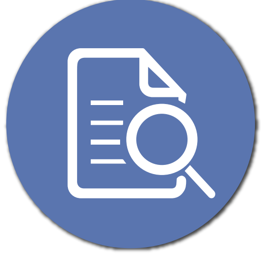
Centros de Investigación