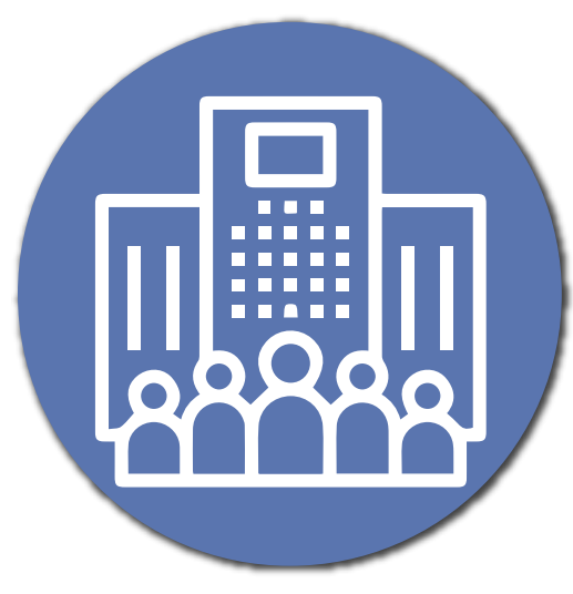
Empresas y Organizaciones

Un Licenciado en Psicología Clínica se puede desempeñar como